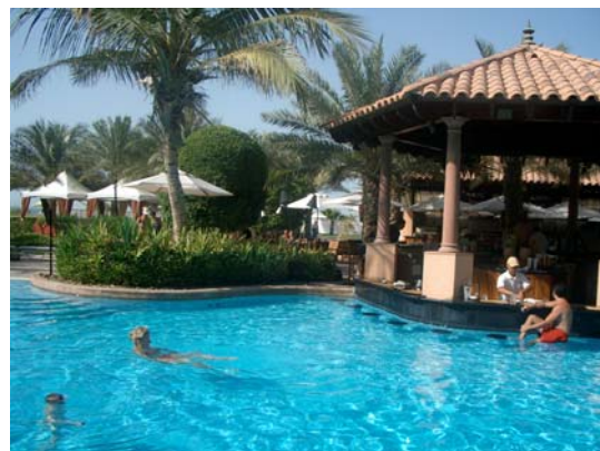
Luxus mit Pool: Ritz-Carlton

Dass es mit dem Öl, das dies alles finanziert, in den nächsten zwanzig Jahren zu Ende gehen wird, wird schon längst nicht mehr als Bedrohung empfunden. Schon heute kommen nur noch sechs Prozent der Wertschöpfung aus dem Öl. Eine Zementfabrik, eine Aluminiumschmelze, eine Erdgas-Raffinerie und ein gewaltiger Freihafen sind neben dem Tourismus die wichtigsten industriellen Einnahmequellen.