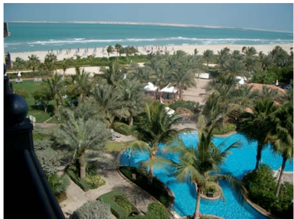
Palmen im Sand: Das Ritz-Carlton

Weiter draußen im Golf entsteht „The World“, ein weiteres riesiges künstliches Inselprojekt mit den Konturen der fünf Kontinente – lauter Antworten auf die Frage, wie man möglichst vielen Menschen einen direkten Zugang zum Meer verschaffen kann. Dagegen muten die klassischen Hotelanlagen wie das üppig-orientalische „Royal Mirage“ oder das europäisch-koloniale „Ritz Carlton“ mit ihren aufwändig begrünten Strandanlagen geradezu altmodisch an: ein halber Kilometer Naturstrand gilt künftig als Luxus.