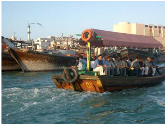
Gastarbeiter auf dem Dubai-Creek

Nur mit mehr Geld: Weil ihre Einnahmen so kräftig sprudelten, dass sie für sich selbst jeden nur erdenklichen Luxus finanzieren konnten und immer noch genug übrig blieb, haben die Makthoums ihr Scheichtum zu einem Wohlfahrtsstaat ausgebaut, der jedem der knapp zweihunderttausend Einwohner ein Leben im Wohlstand sichert. Nirgendwo sieht man so viele prächtige Villen, Luxuslimousinen und teure Sportwagen; Gesundheits- und Altersversorgung sind selbstverständlich kostenlos; Kindergeld liegt auf dem Niveau westlicher Wohlfahrtsstaaten, und alleinstehende Frauen über vierzig werden vom Staat versorgt.