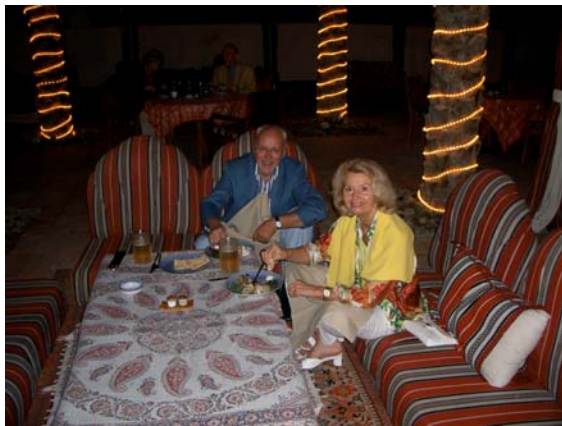
Arabisch essen im Hotel

Der Normaltourist verläßt seine komfortable Hotelanlage praktisch nie – es sei denn, er läßt sich der Kuriosität halber einmal in die Altstadt und zum berühmten „Gold-Souk“ bringen. Arabische Folklore liefern die Hotels frei Haus, indem sie mehr oder weniger gelungene Kopien beduinischer Tischsitten in ihren (meist unter freiem Himmel in der Nähe des Pools