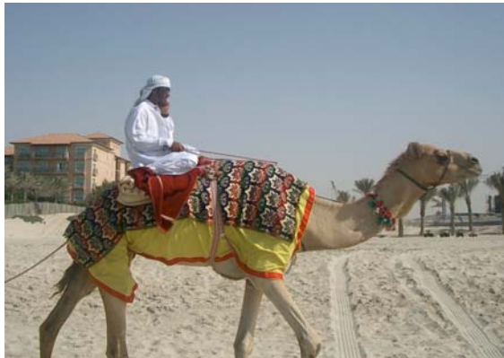
Zwei Welten: Kamelreiter mit Handy

Kein Tag vergeht in Dubai ohne eine neue Erfolgsmeldung im Wirtschaftsteil der „Golf News“. Boomtown ist Jumeirah, ein sandiger Küstenstreifen 20 Kilometer südlich der Hauptstadt rund um das legendäre Hotel „Burj Al Arab“, das vor drei Jahren wegen seiner Prunk- und Protz-Ausstattung für Aufmerksamkeit sorgte. Dort entsteht „Al Mina“, eine weitläufige Luxus-Hotelanlage im Stil einer Beduinenstadt mit einer Unzahl von Windtürmen, das erste Unterwasser-Hotel der Welt, und das „Jumeirah Beach Resort“, eine Batterie von mindestens einem Dutzend Hochhäusern mit Tausenden von Eigentumswohnungen mit Meerblick.